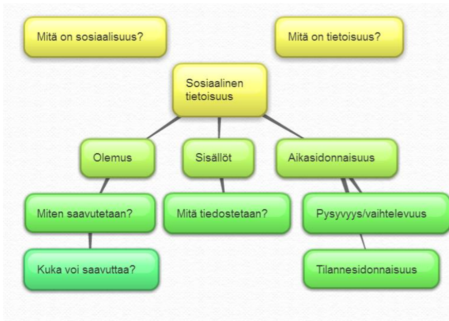
Kaavio 3. Sosiaalisen tietoisuuden käsitteen merkitysulottuvuudet.

Ensin esittelen tutkimustuloksina saadut sosiaalisen tietoisuuden sisällöt, eli ne merkitysulottuvuudet, joihin olen jaotellut käsitteenmäärittelyt aineiston valossa (liite 2). Nämä sisällöt olen aineiston avulla jakanut ylä- ja alaryhmiin. Nämä ryhmät tuovat esiin sen, mitä tiedostetaan kun puhutaan sosiaalisesta tietoisuudesta. Seuraavaksi pohdin sosiaalisen tietoisuuden aikajänteitä, eli sitä, nähdäänkö sosiaalinen tietoisuus pysyvänä ominaisuutena vai vaihteleeko se tilanteen mukaan. Kolmantena pohdin sosiaalisen tietoisuuden olemusta ylipäätään: onko se synnynnäinen taito vai voidaanko sosiaalista tietoisuutta harjoittaa ja kehittyä siinä. Lopuksi erittelen vielä sosiaalisen tietoisuuden käsitteen osat, eli minkä näkökulman sana sosiaalinen tuo käsitteeseen ja mitä tarkoitetaan tietoisuudella .