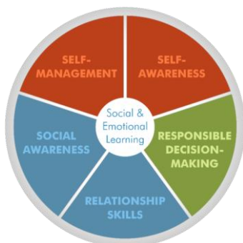
Kaavio 2. Sosioemotionaalisen oppimisen avainkompetenssit (CASEL 2015).

Toinen esimerkki sosiaalisen tietoisuuden yleisemmän tason määritelmästä on Collaborative for Academic, Social, and Emotional Learning -järjestön (2015) muodostama viiden toisiinsa kytkeytyvän sosioemotionaalisen oppimisen avainkompetenssin kehä, johon kuuluu: self-awareness, self-management, social awareness, relationship skills ja responsible decision making. Nämä viisi ryhmää muodostavat yhdessä sosioemotionaalisen oppimisen kehän. Tässä mallissa sosiaalinen tietoisuus nähdään myös osana laajempaa kokonaisuutta, jossa eri osatekijät muodostavat yhdessä sosioemotionaaliset taidot. Casel (2015) määrittelee sosiaalisen tietoisuuden myös kuuluvan osana johonkin suurempaan kokonaisuuteen, mutta tutkimuksissa käsitettä käytetään yleensä vain omana osatekijänä.